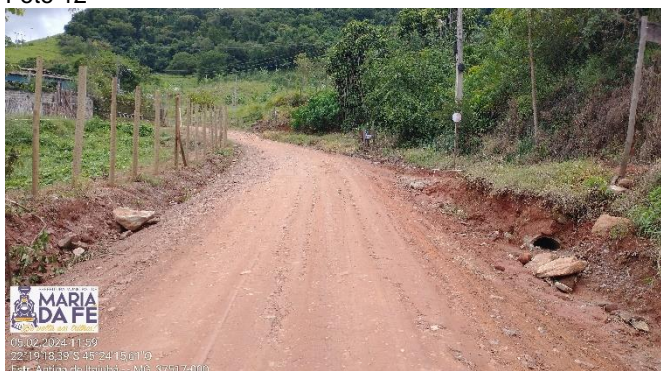
Trecho a ser pavimentado, 05/02/2024.