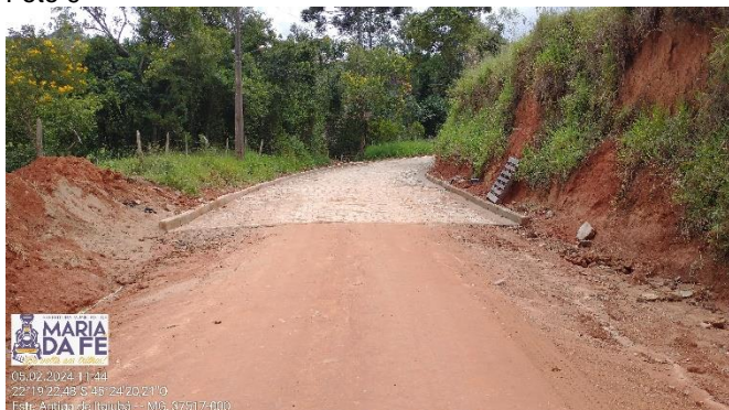
Trecho a ser pavimentado, 05/02/2024.