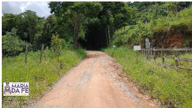
Trecho a ser pavimentado, 05/02/2024.