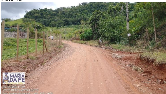
Trecho a ser pavimentado, 05/02/2024.