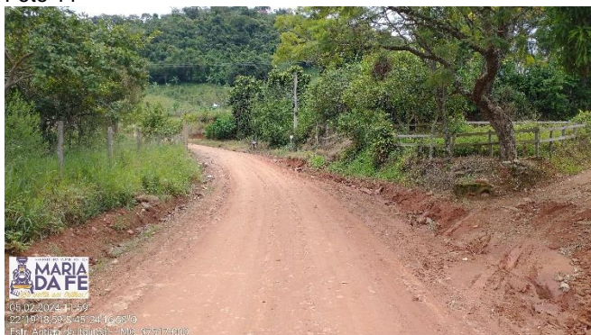
Trecho a ser pavimentado, 05/02/2024.