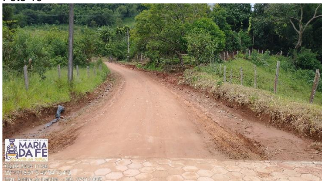
Trecho a ser pavimentado, 05/02/2024.