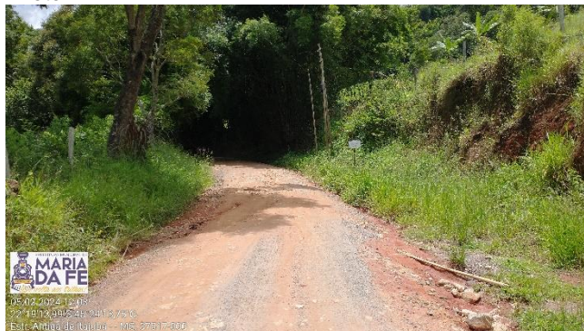
Trecho a ser pavimentado, 05/02/2024.